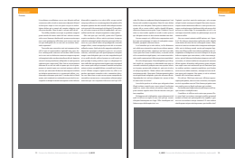
1/2 Seite quer 190 x 118 mm 1/3 Seite quer 190 x 75 mm