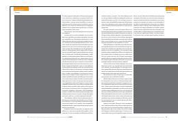
1/2 Seite hoch 112 x 238 mm 1/4 Seite 112 x 118 mm 1/8 Seite 112 x 55 mm